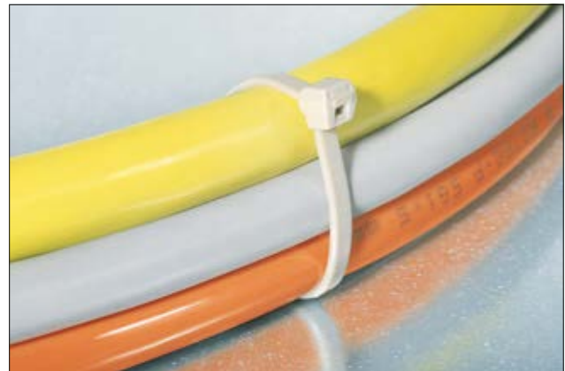
Der hitzebeständige PEEK-Kabelbinder PT220 für Hochtemperaturanwendungen.

PEEK Kabelbinder wurden für den Einsatz in extremer Umgebung entwickelt. Durch das Hochleistungsmaterial PEEK können die Kabelbinder in Umgebungen mit Betriebstemperaturen von bis zu +240 °C eingesetzt werden. PEEK Kabelbinder können durch ihre hohe Temperaturbeständigkeit diverse Metallösungen ersetzen und zur Gewichtseinsparung im Luftfahrtbereich oder der Automobilindustrie beitragen. Aber auch im Schienenfahrzeugbau und der chemischen Industrie kommen PEEK Kabelbinder seit längerem zum Einsatz. Die sehr gute Chemikalien- und Strahlenbeständigkeit erweitert den Einsatzbereich von PEEK um die Medizintechnik.