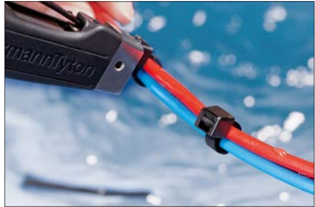
Polypropylen Kabelbinder für erhöhte chemische Anforderungen und Temperaturen bis +115 °C.