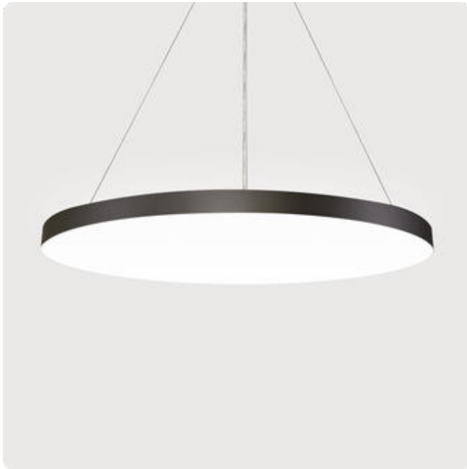
Abbildungen ggf. nur ähnlich, dienen als Orientierung.