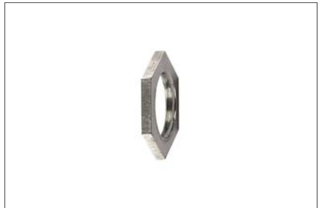
HelaGuard ALSS Gegenmutter, rostfreier Edelstahl.

Die sechskantige ALSS Gegenmutter dient als zusätzliche Sicherung der Verschraubung.