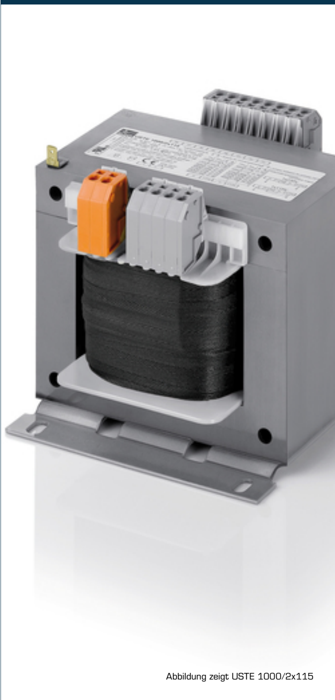
Abbildung zeigt USTE 1000/2x115