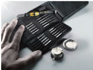
Kraftform Micro ESD Bits-Handhalter