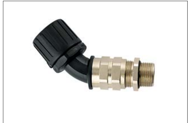
HeliaGuard HG-45CG 45°-Verschraubung mit Zugentlastung und Kabelabdichtung, Außengewinde.