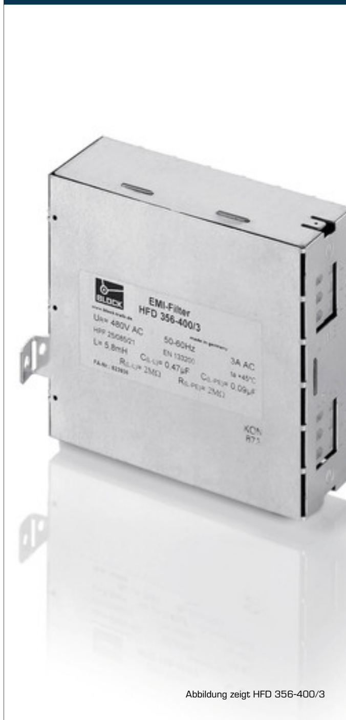
Abbildung zeigt HFD 356-400/3