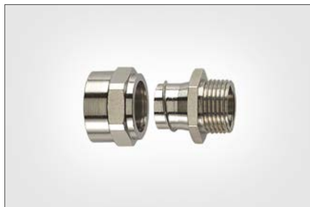
HeloGuard PCSB-FM mit starrem Außengewinde.