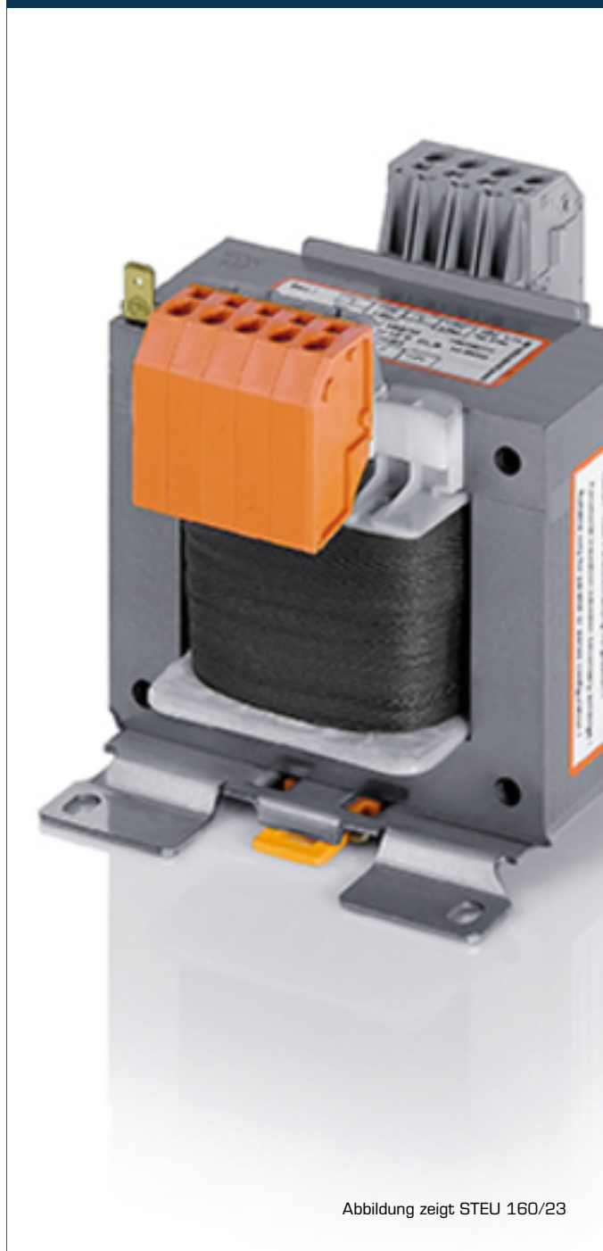
Abbildung zeigt STEU 160/23