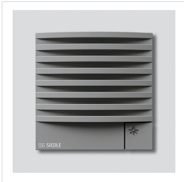
Türlautsprecher-Modul Multi TLM 645-02 TM 200087562-00