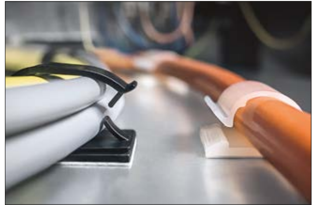
Einteilige, selbstklebende Befestigungssockel RB20 (l) und RB14 (r).