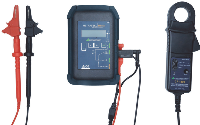
Bild 2: Batterieprüfgerät mit AC/DC-Zangenstromsensor CP1800 (Z204A)