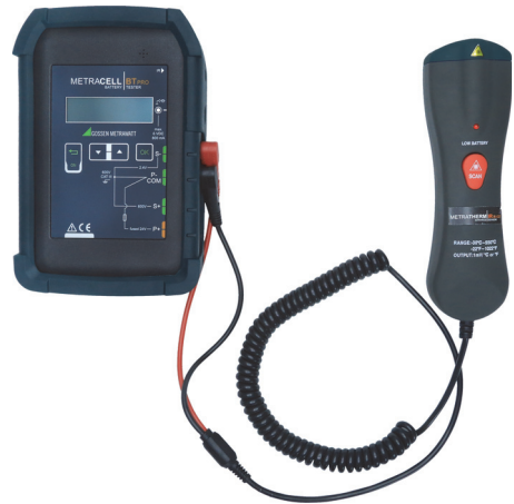
Bild 3: Batterieprüfgerät mit Temperatursensor METRATHERM IR BASE (Z680A)