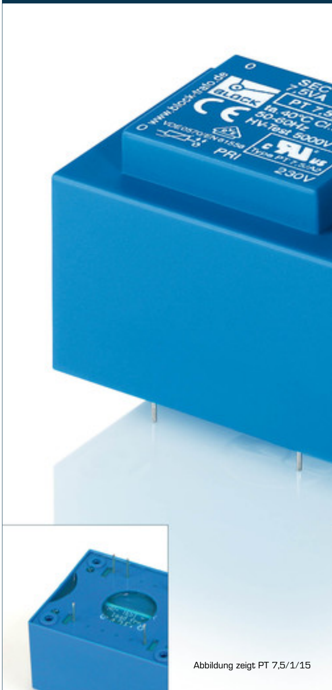
Abbildung zeigt PT 7,5/1/15