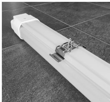
EDELSTAHLDECKENHALTER MIT ABPENDELOPTION