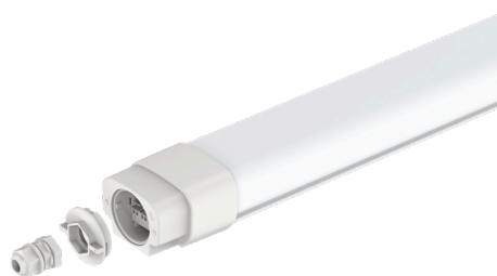
HOHER SCHUTZ VOR EINDRINGENDER FEUCHTIGKEIT DURCH RAST-SCHRAUB-VERBINDUNG MIT DICHRING