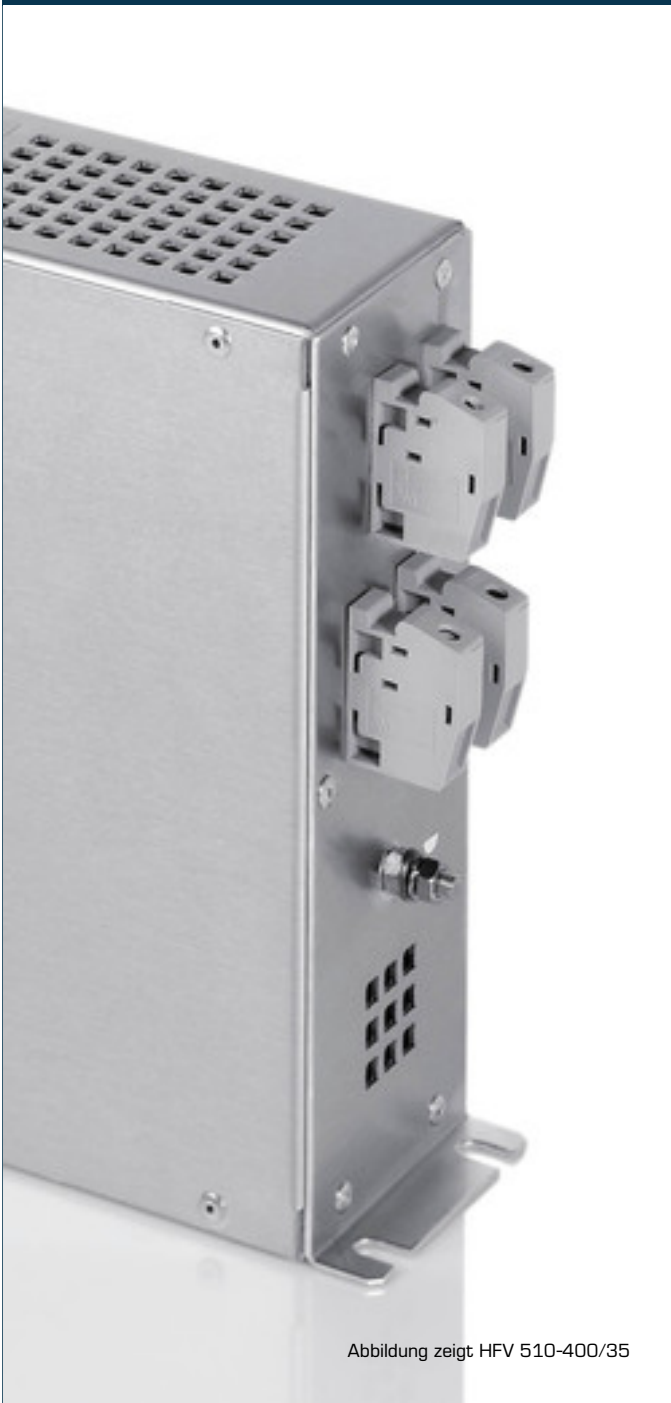
Abbildung zeigt HFV 510-400/35