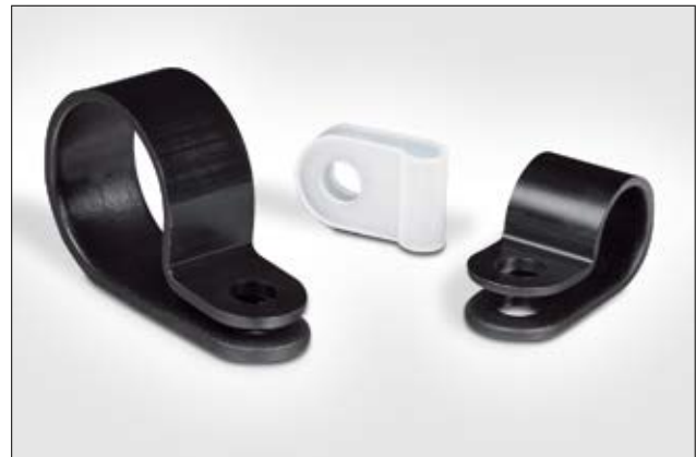
Die Kunststoffschellen der HP-Serie sind in verschiedenen Größen erhältlich.