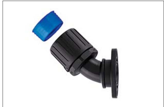
HelaGuard HGL-45FL 45° drehende Flanschverschraubung inkl. Schlauchdichtung.