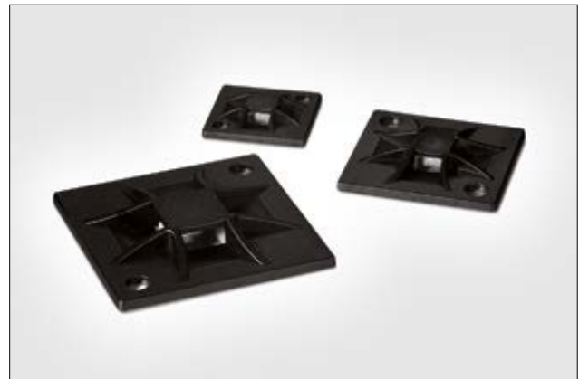
Q-Mount Befestigungssockel mit gewölbter Kabelbandaufnahme für sicheren Halt des Kabelbinders.