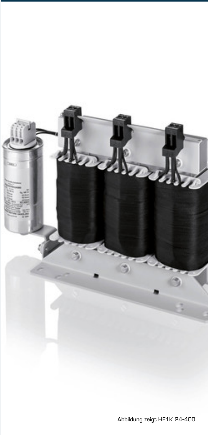
Abbildung zeigt HF1K 24-400