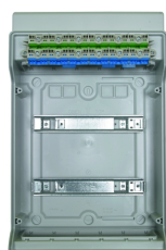
Integrierte Steckklemmtechnik für PE und N.