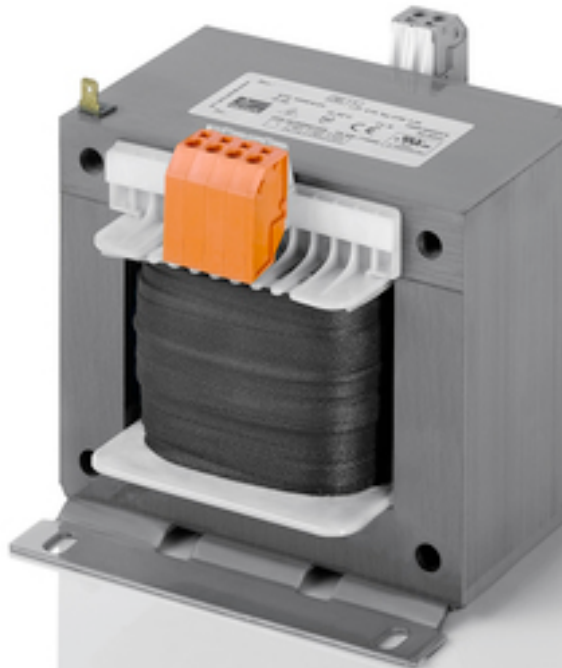
Abbildung zeigt STE 1000/4/23