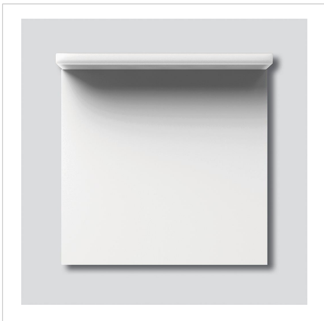
LED-Flächenleuchte LEDF 600-3/3-0 W 200037343-00