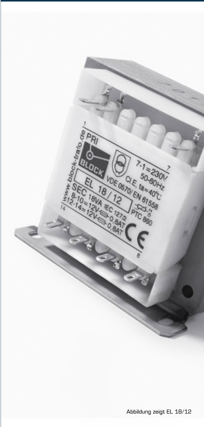
Abbildung zeigt EL 18/12