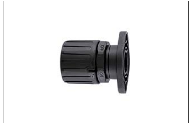
HeliaGuard HG-SFL gerade, drehende Flanschverschraubung.