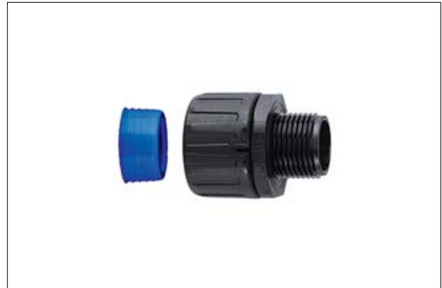
HelaGuard HGL-S gerade Verschraubung mit Außengewinde inkl. Schlauchdichtung.