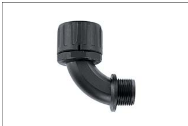
HelaGuard HG-90 90°-Verschraubung mit Außengewinde.