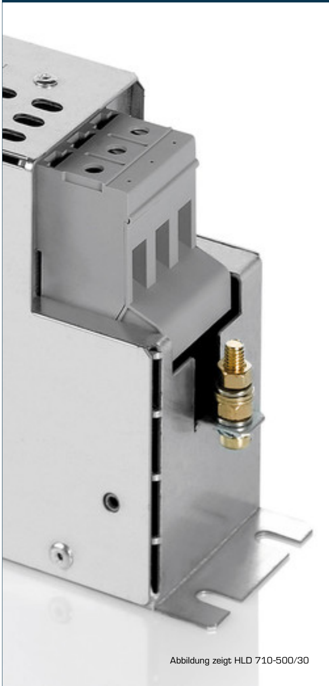
Abbildung zeigt HLD 710-500/30