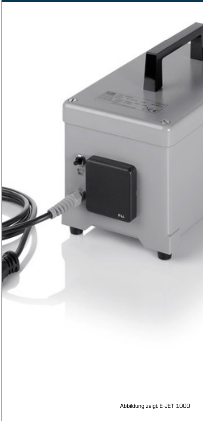
Abbildung zeigt E-JET 1000