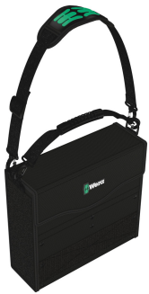
Wera 2go 2 05004351001 1 x 3-teilig