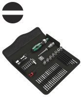
Kraftform Kompakt H1 Holz 05135939001 1) 1 x 41-teilig 05135939001 1) 1 x 41-teilig 05135939001 1) 1 x 41-teilig 05135939001 1) 1 x 41-teilig 05135939001 1) 1 x 41-teilig 05135939001 1) 1 x 41-teilig 05135939001 1) 1 x 41-teilig 05135939001 1) 1 x 41-teilig 05135939001 1) 1 x 41-teilig 05135939001 1) 1 x 41-teilig

1) Produkt nicht in den USA und Kanada erhältlich.