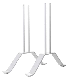
Zubehör: Standfüße VZ-VF-SF