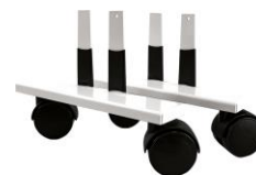
Zubehör: Laufrollen VZ-VF-LR