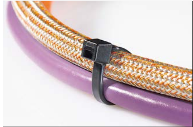
LK-Serie als Ergänzung zur HellermannTyton T-Serie.