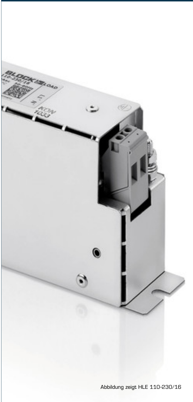
Abbildung zeigt HLE 110-230/16