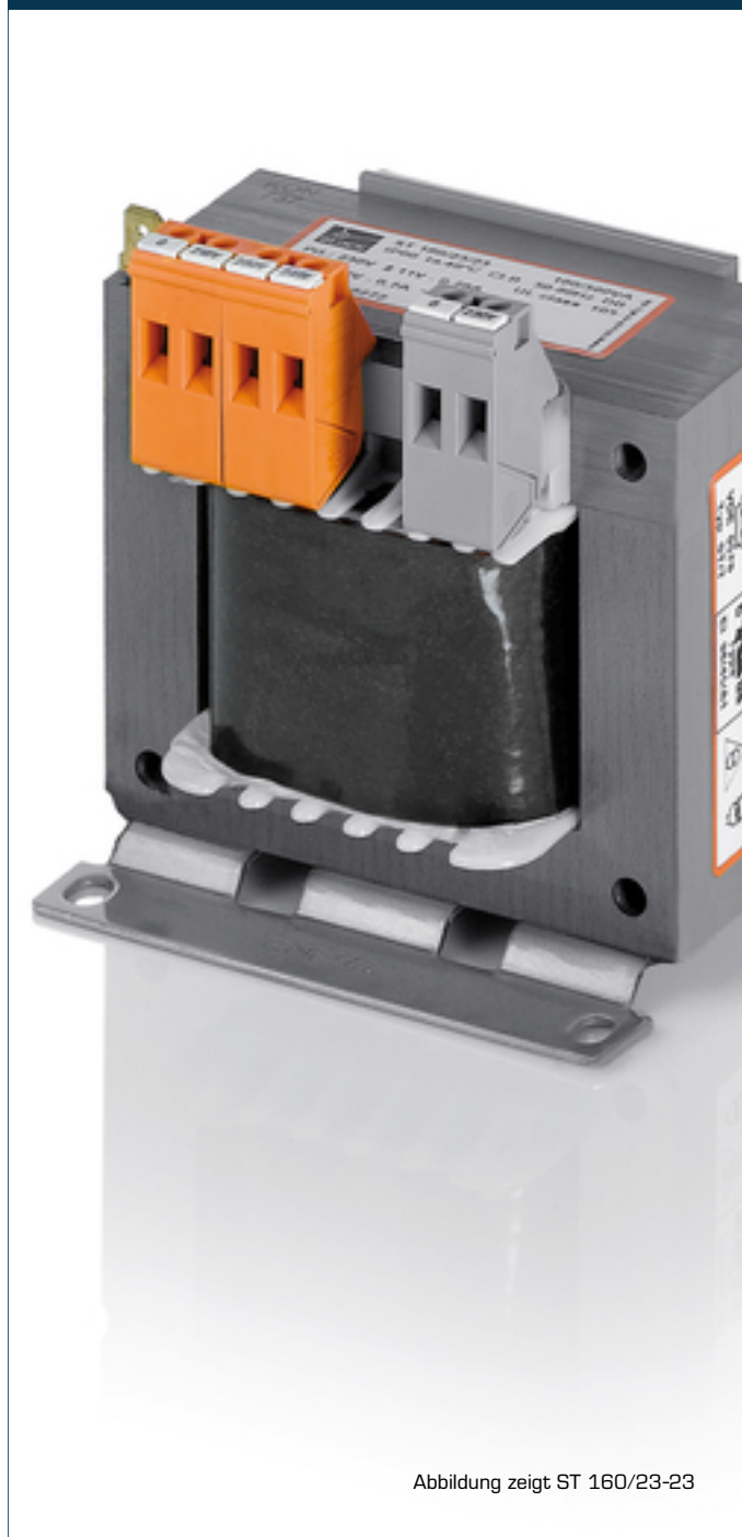
Abbildung zeigt ST 160/23-23