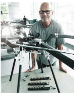
Die Wera Belts