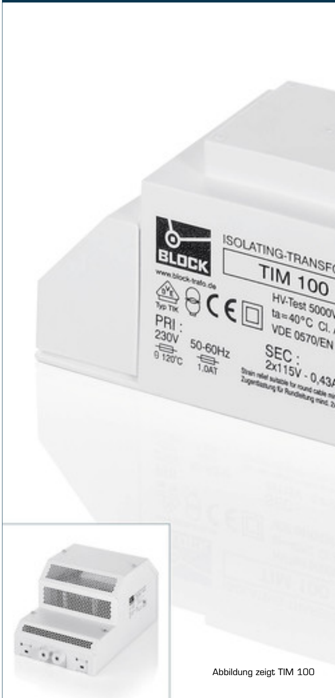
Abbildung zeigt TIM 100