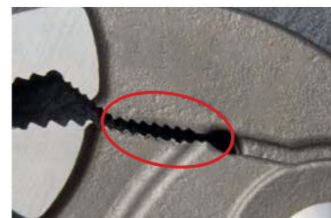
gegenläufige Verzahnung für aggressives Zupacken