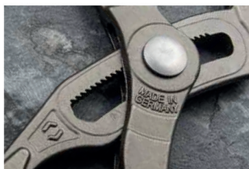
verfeinerte Abstufung für bessere Ergonomie