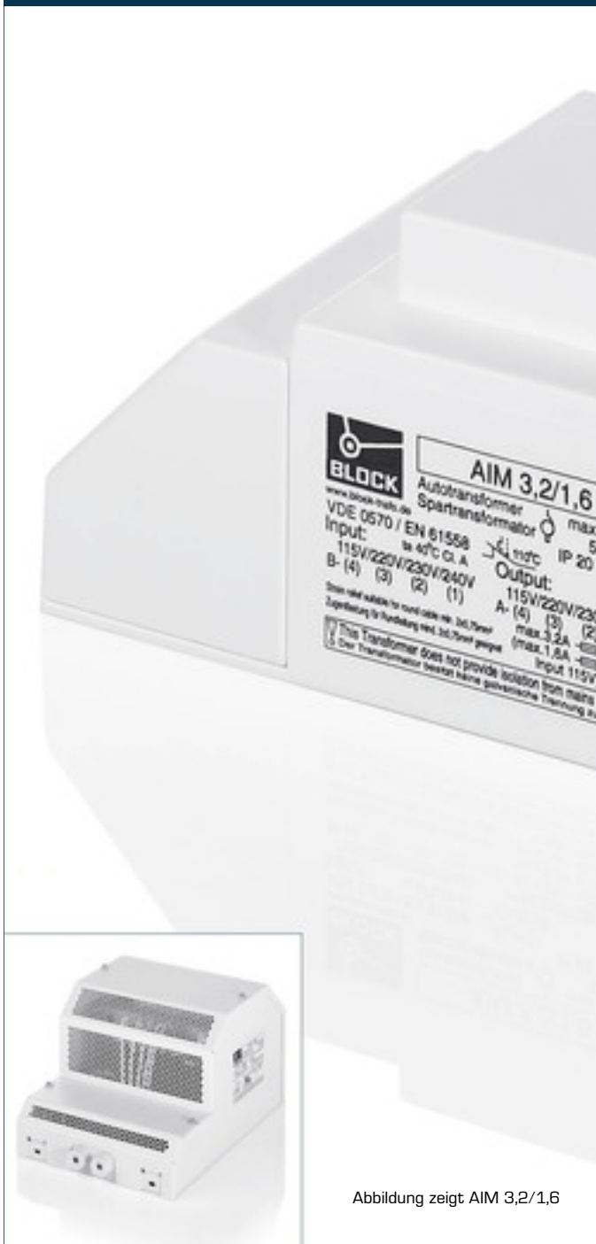
Abbildung zeigt AIM 3,2/1,6