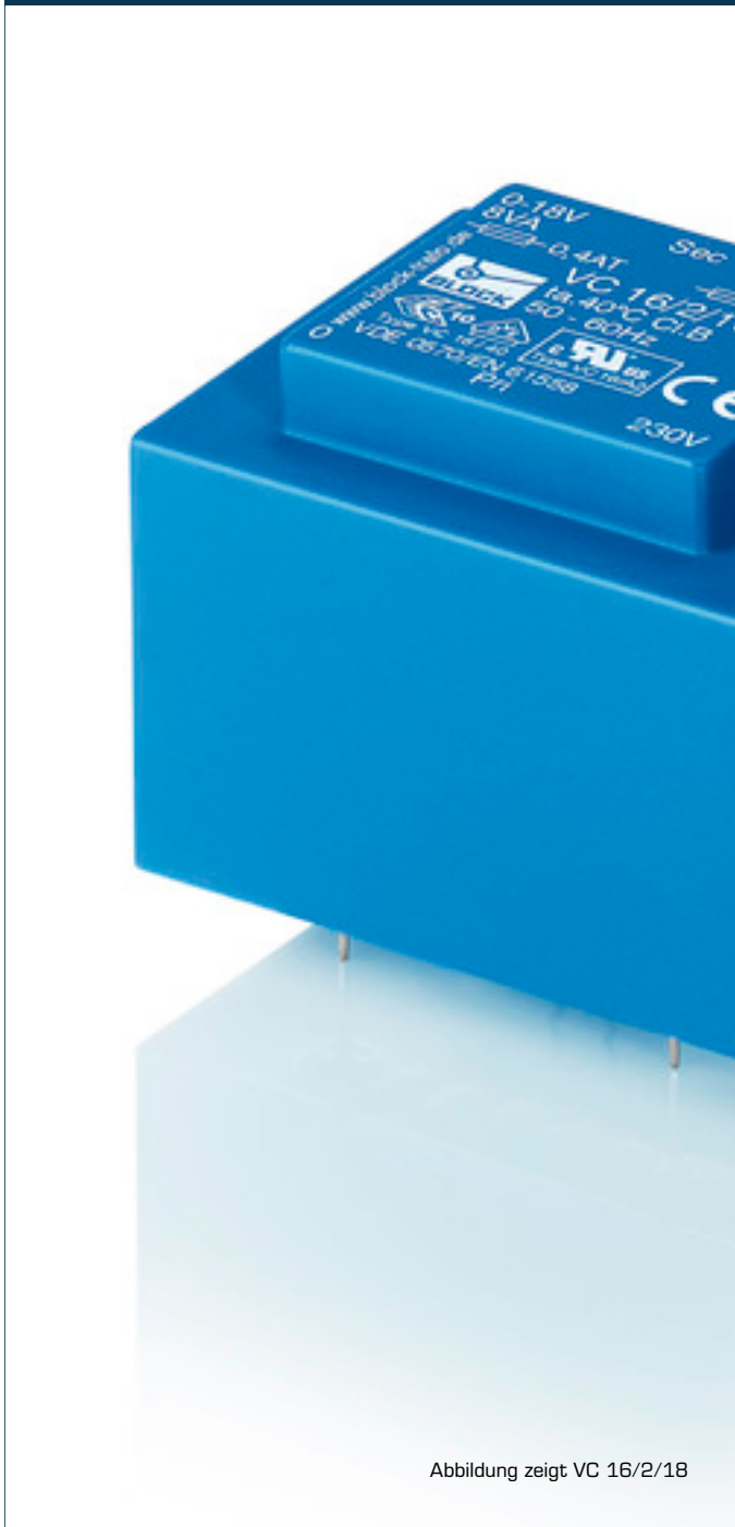
Abbildung zeigt VC 16/2/18