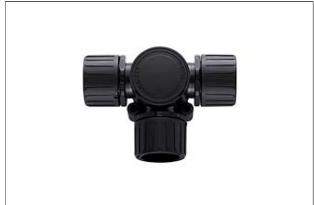
HeliaGuard HG-T T-Verteiler mit Inspektionsdeckel.