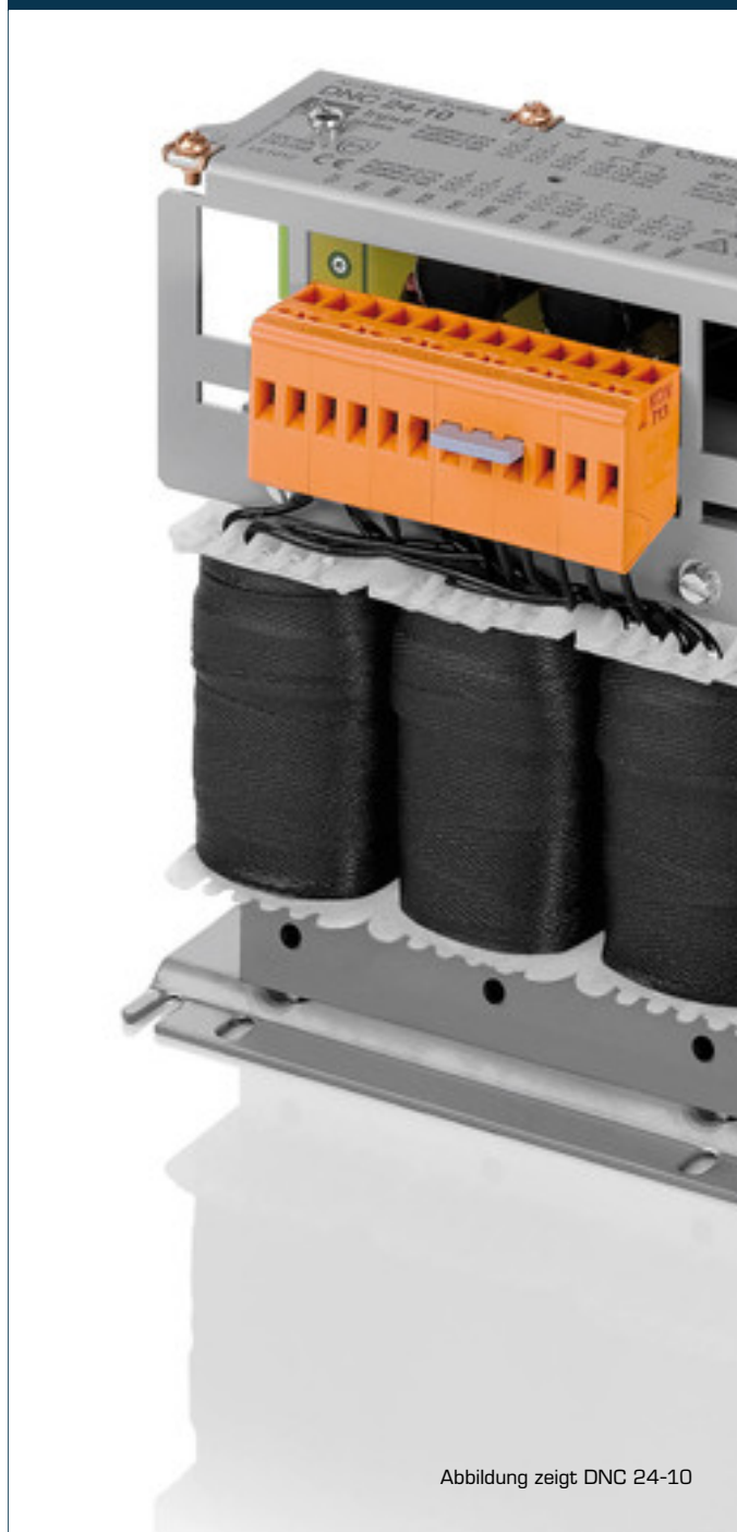
Abbildung zeigt DNC 24-10