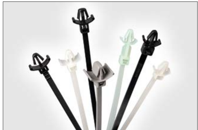
Befestigungsbinder mit Spreizanker gibt es in verschiedenen Variationen. Sie lassen sich fühl- und hörbar verarbeiten.