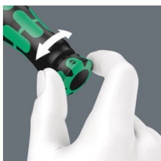
Mit hör- und fühlbarem Einrasten bei Erreichen der Skalenwerte.