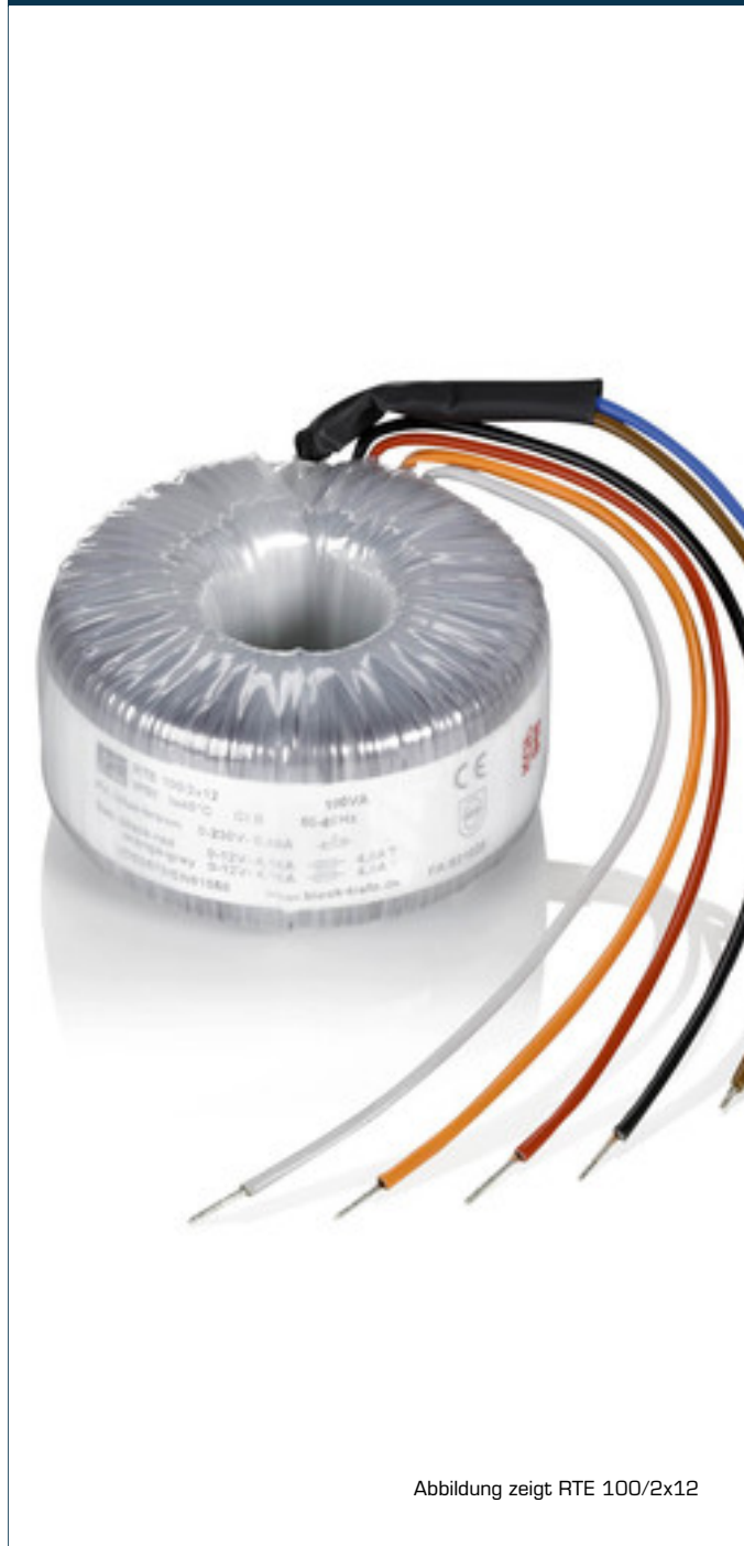
Abbildung zeigt RTE 100/2x12