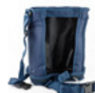
SP-0400 Tragetag & Arbeitstasche für Combi 400er Serie 38,- € Art.-Nr.: 2004100