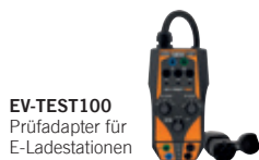
EV-TEST100 Prüfadapter für E-Ladestationen