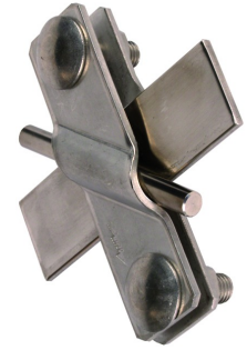
Figures without obligation