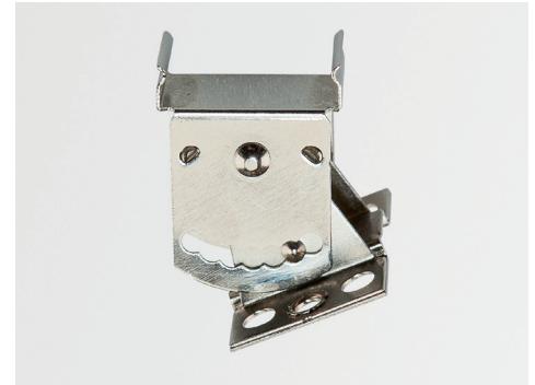
Winkelstück für abgeneigte Montage