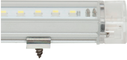
LED Endlostube mit Befestigungsprofil

Andere Lichtfarben oder Längen auf Anfrage.