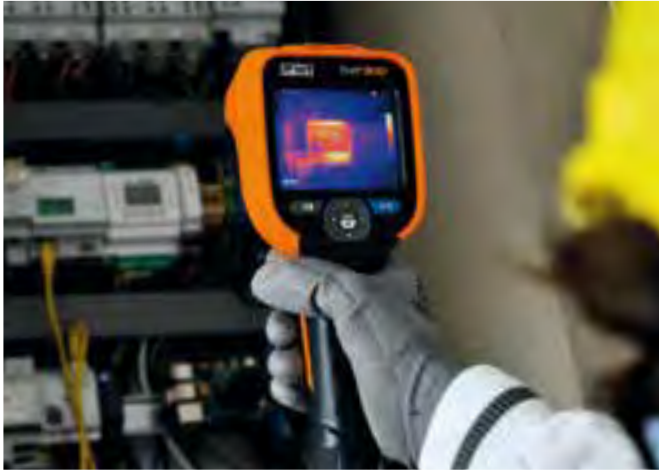
Ein überhitzer Lüftermotor aufgenommen mit der THT300