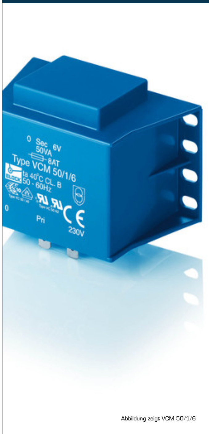
Abbildung zeigt VCM 50/1/6