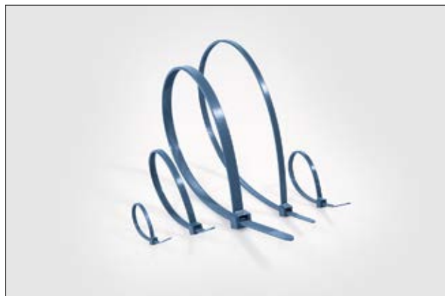
MCTPP Kabelbinder haben eine sehr gute chemische Beständigkeit und sind auch für einen höheren Temperaturbereich geeignet.