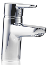
Die Armatur-Empfehlung EWT

Die optimierten Wege sorgen für 80% weniger stehendes Wasser im Armaturenkörper im Vergleich zu herkömmlichen Einhebelmischern.