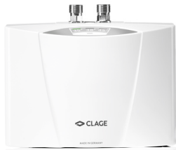
Beste Funktionalität und anspruchsvolles Design